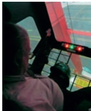
ガントリークレーンの操作シュミレータを体験 Prueba en el simulador de manejo de grúa pórtico