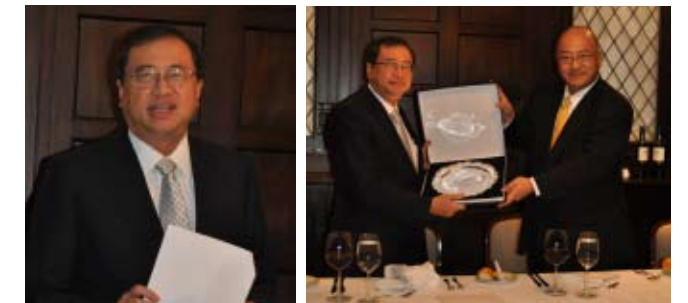
(左) 任期を振り返る目賀田大使、(右) 高瀬会頭より記念の銀のプレートが授与された Izquierda: Embajador Megata recuerda los logros de su mandato, Derecha: Entrega de plato recordatorio por el Presidente Takase

El Embajador del Japón en el Perú Shuichiro Megata —designado como Embajador a México— fue invitado a fin de intercambiar opiniones sobre la profundización de la relación bilateral y la proyección a futuro, luego de haber cumplido funciones con permanente dedicación y compromiso durante 3 años en el Perú. Participaron 22 directores y fiscales. Además de recordar algunos de los logros durante su mandato como la visita de sus Altezas Imperiales los Príncipes Hitachi al Perú, la suscripción y entrada en vigencia del Acuerdo para la Promoción, Protección y Liberalización de la Inversión, las negociaciones del TLC Perú-Japón desde los inicios hasta su finalización, y la adopción del estándar japonés-brasileño para el sistema de Televisión Digital Terrestre en el Perú, entre otros; se conversó sobre la importancia del Perú para el Japón.