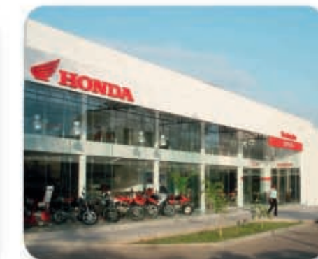
La mayor red de concesionarios a nivel nacional.