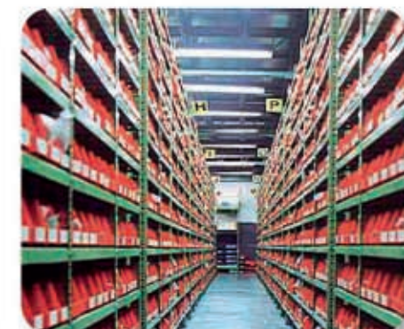
Almacén de repuestos con amplio stock.