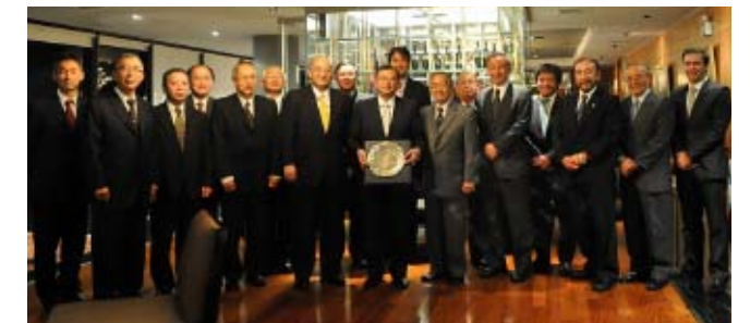
目賀田大使と懇談会に参加した役員 El Embajador Megata y los participantes del conversatorio

駐ペルー日本国特別全権大使として3年余に亘り、その手腕を遺憾なく発揮された目賀田周一郎大使が駐メキシコ大使として異動されるにあたり、日本・ペルー二国間関係の深化の足跡と今後の見通し等について意見を交わすことを目的に懇談会を開催し、当所からは高瀬会頭をはじめとする全役員22人が参加した。大使からは常陸宮殿下、妃殿下のご来訪、投資協定調印・発効、EPA交渉開始から合意、地上波デジタル放送の日本ブラジル方式採用など数々の実績を残された任期中の思い出をご披露頂いた他、日本にとってのペルーの重要性などについて活発な意見交換が行われた。