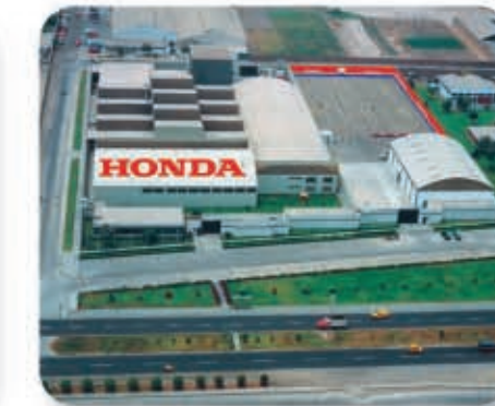
Centro de investigación y desarrollo • Planta Callao