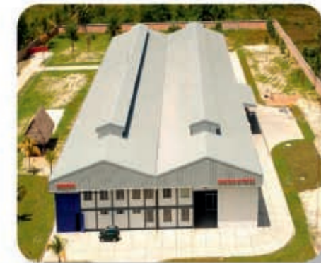
Planta de motocicletas Honda Iquitos