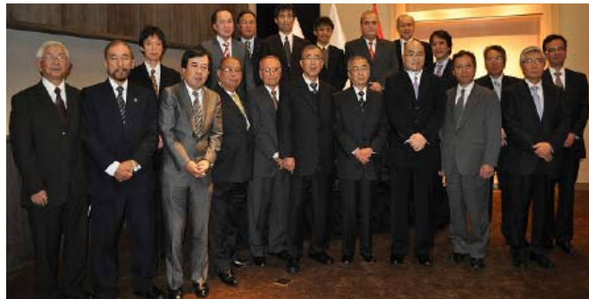
日秘商工会議所2011年-2012年度新役員の皆様 / Junta Directiva 2011-2012 de CCIPJ

2011年-2012年度臨時総会をリマ市内のホテルにて開催。会員57人（委任含む）が参加した。議案の2011年-2012年度事業計画と同予算案は異議なく承認された。