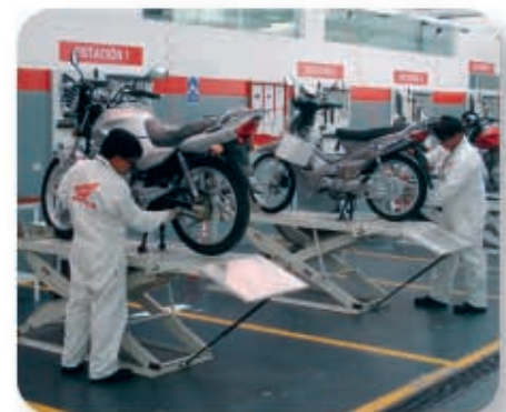
Más de 90 Servicios Técnicos Autorizados en todo el Perú.